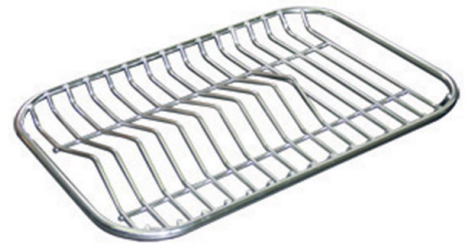
不锈钢背板 8100 280