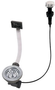
自动下水 8407 100